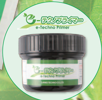
e-テクノプライマー e-Techno Primer